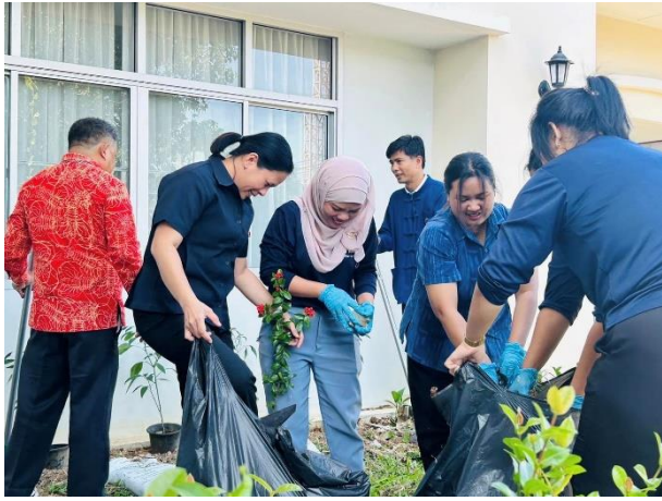
กิจกรรมจิตอาสา ซอแรง