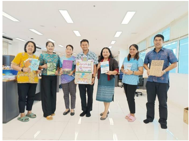
กิจกรรมปันความรักด้วยความรู้