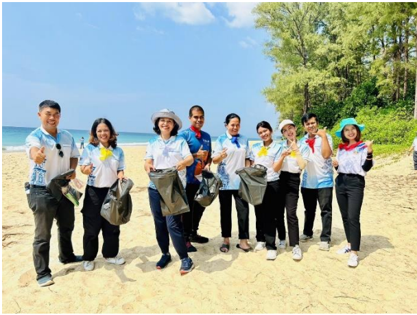
กิจกรรมโลกสวยด้วยมือเรา