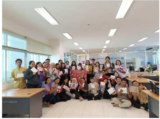
กิจกรรม Good Card Give You